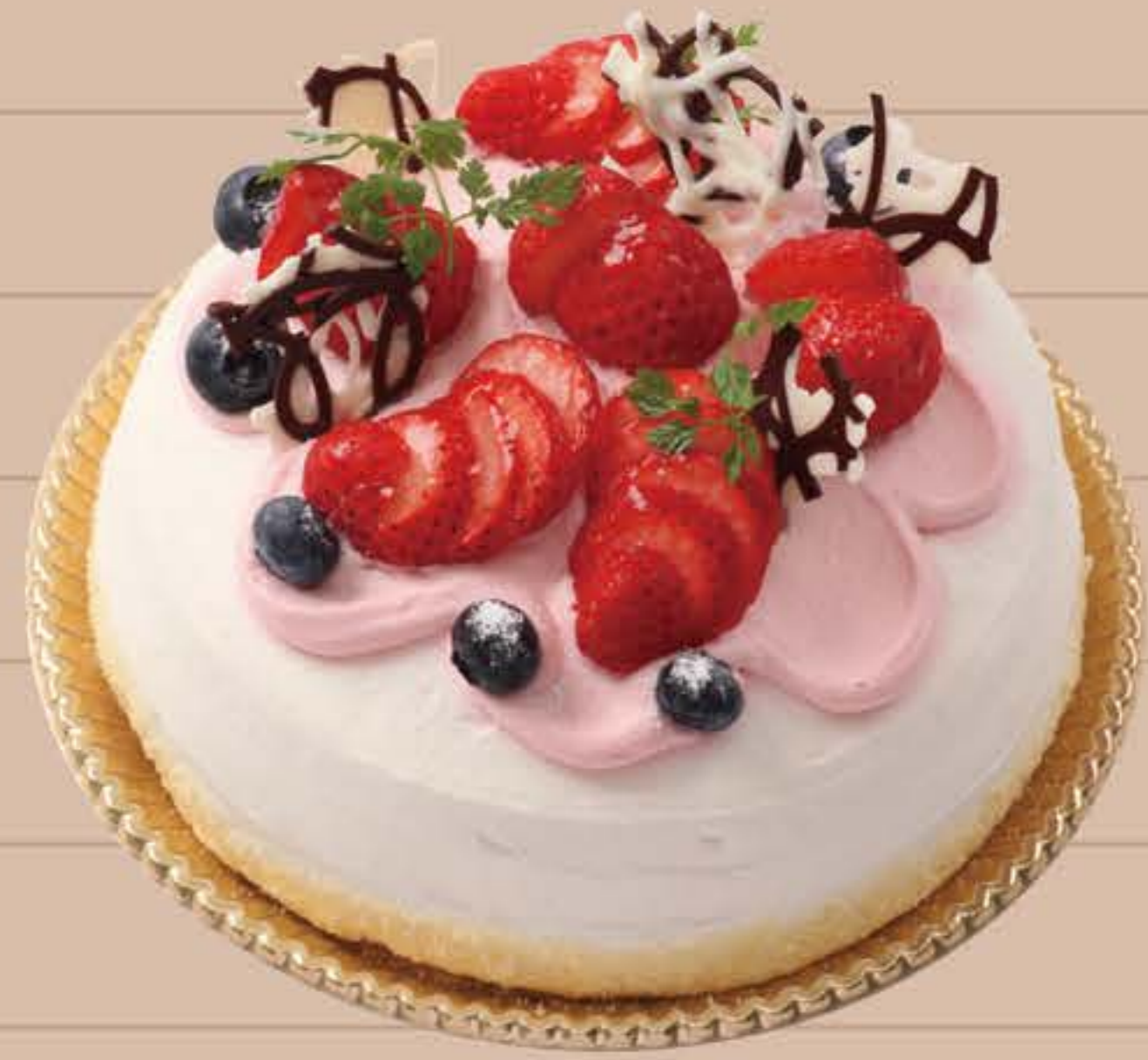
デコレーションケーキ

4号(12cm)… ¥2,250 5号(15cm)… ¥3,450 6号(18cm)… ¥4,250 7号(21cm)… ¥6,250 8号(24cm)… ¥8,650 9号(27cm)… ¥11,850 10号(30cm)… ¥14,850