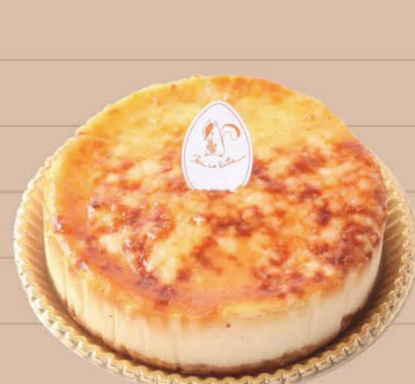
バイクドカマンベール

4号(12cm)… ¥1,850 5号(15cm)… ¥2,850 6号(18cm)… ¥3,850 7号(21cm)… ¥5,650