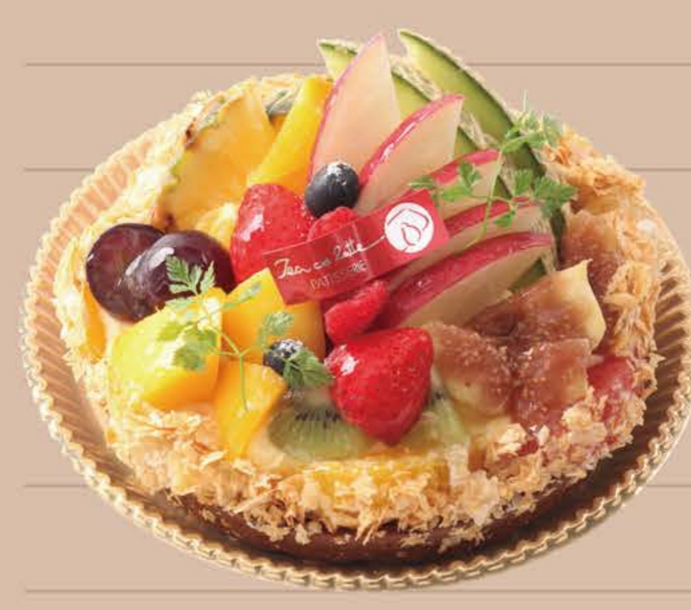
贅沢フルーツタルト

※上記価格は1~5月までの価格です。 6~12月の価格は異なりますので、店頭までお問い合わせください。 ※7・8号は受渡日の4営業日前予約