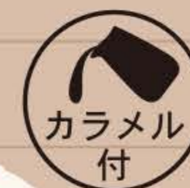
ティ・コ・ラッテ バニラキャラメル

5号(15cm)… ¥2,250 6号(18cm)… ¥3,450 7号(21cm)… ¥4,250 8号(24cm)… ¥6,700