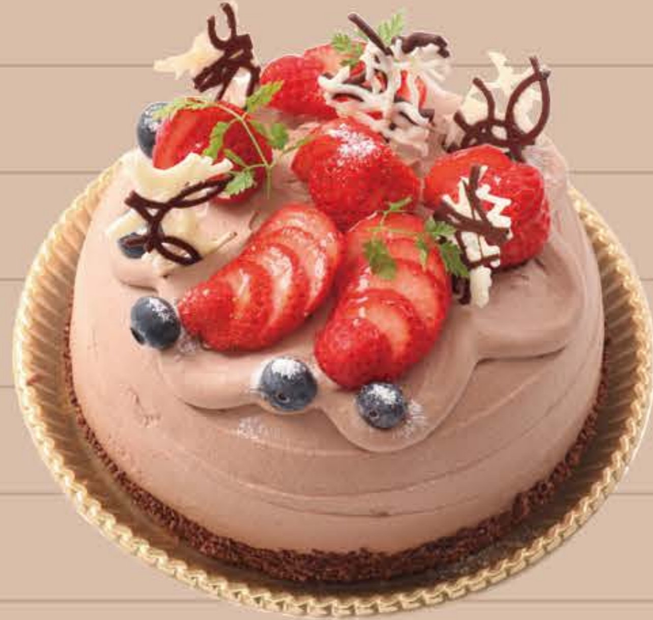
生チョコデコレーションケーキ

4号(12cm)… ¥2,550 5号(15cm)… ¥3,850 6号(18cm)… ¥4,750 7号(21cm)… ¥7,050 8号(24cm)… ¥9,450 9号(27cm)… ¥12,850 10号(30cm)… ¥15,850