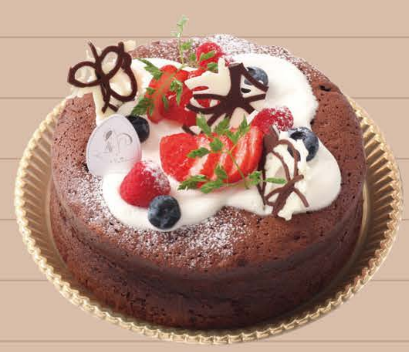
リッチガトーショコラ

4号(12cm)… ¥1,850 5号(15cm)… ¥2,650 6号(18cm)… ¥3,450 7号(21cm)… ¥5,050