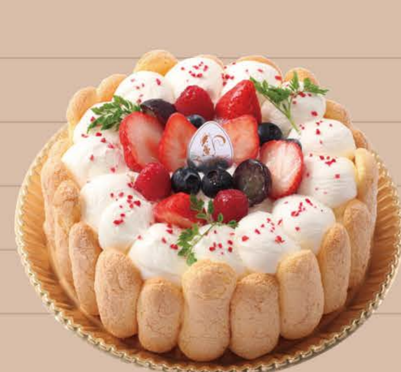
ベリーベリービスキュイ

4号(12cm)… ¥2,650 5号(15cm)… ¥3,950 6号(18cm)… ¥4,850