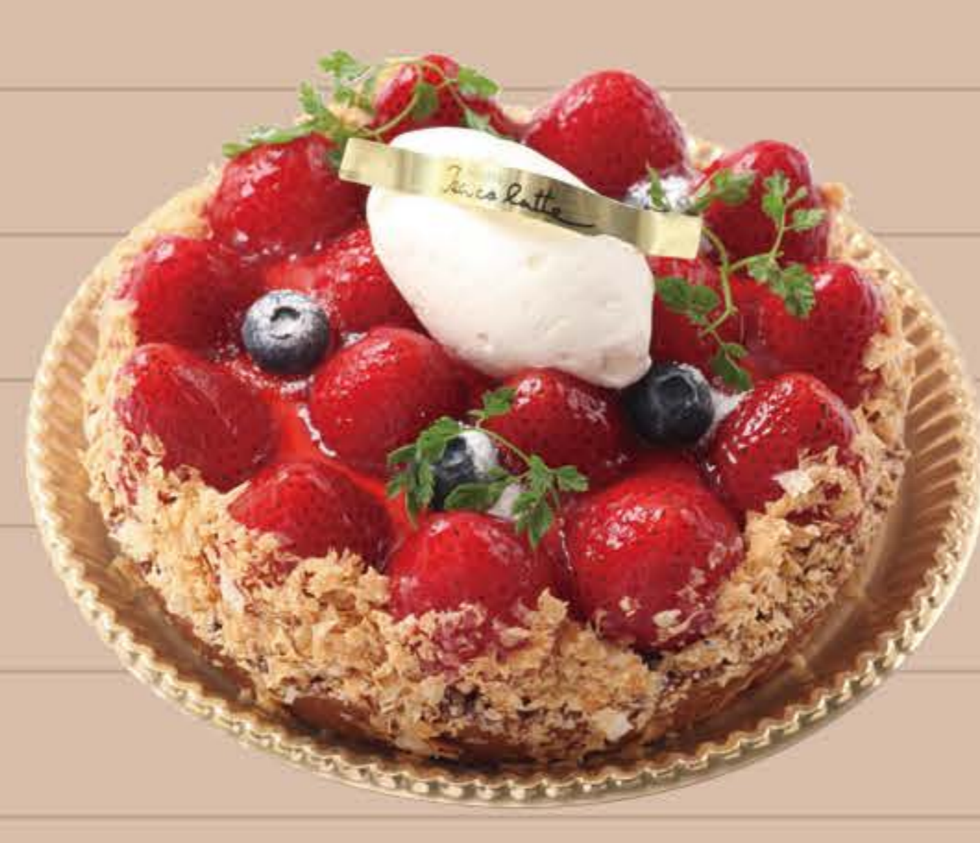
贅沢イチゴタルト

4号(12cm)… ¥1,650 5号(15cm)… ¥3,150 6号(18cm)… ¥3,950 7号(21cm)… ¥5,850 8号(24cm)… ¥7,850