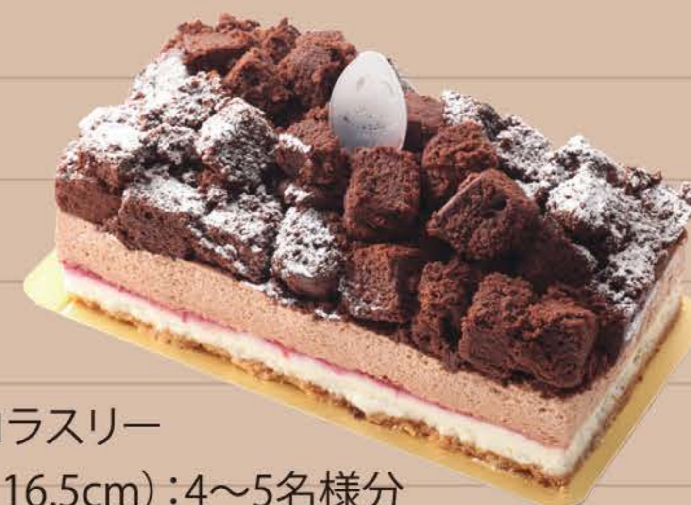
ショコラスリー (9×16.5cm):4~5名様分