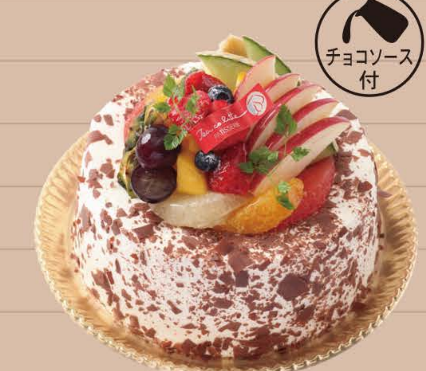
ティ・コ・ラッテ ショコラマーブル

5号… ¥3,000 (税込) 7号… ¥5,200 (税込) 6号… ¥4,200 (税込) 8号… ¥8,600 (税込)