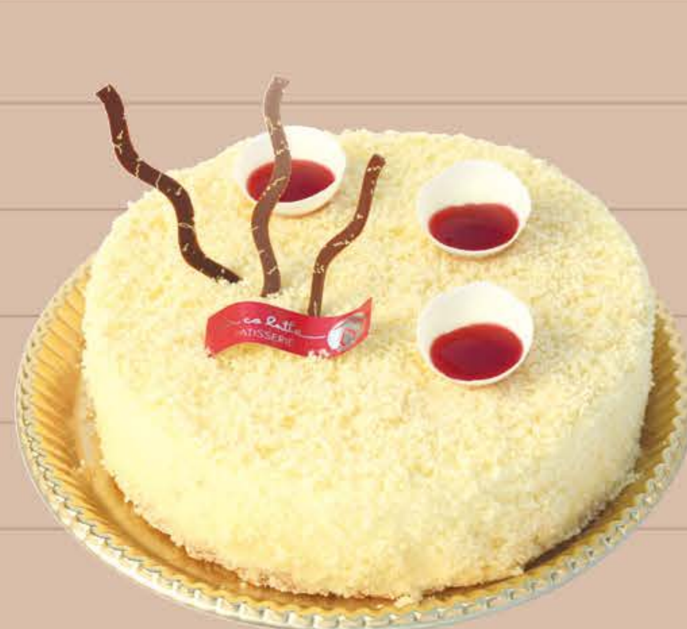
信州安曇野フロマージュ

4号… ¥3,200 (税込) 6号… ¥5,700 (税込) 5号… ¥4,400 (税込) 7号… ¥8,200 (税込)