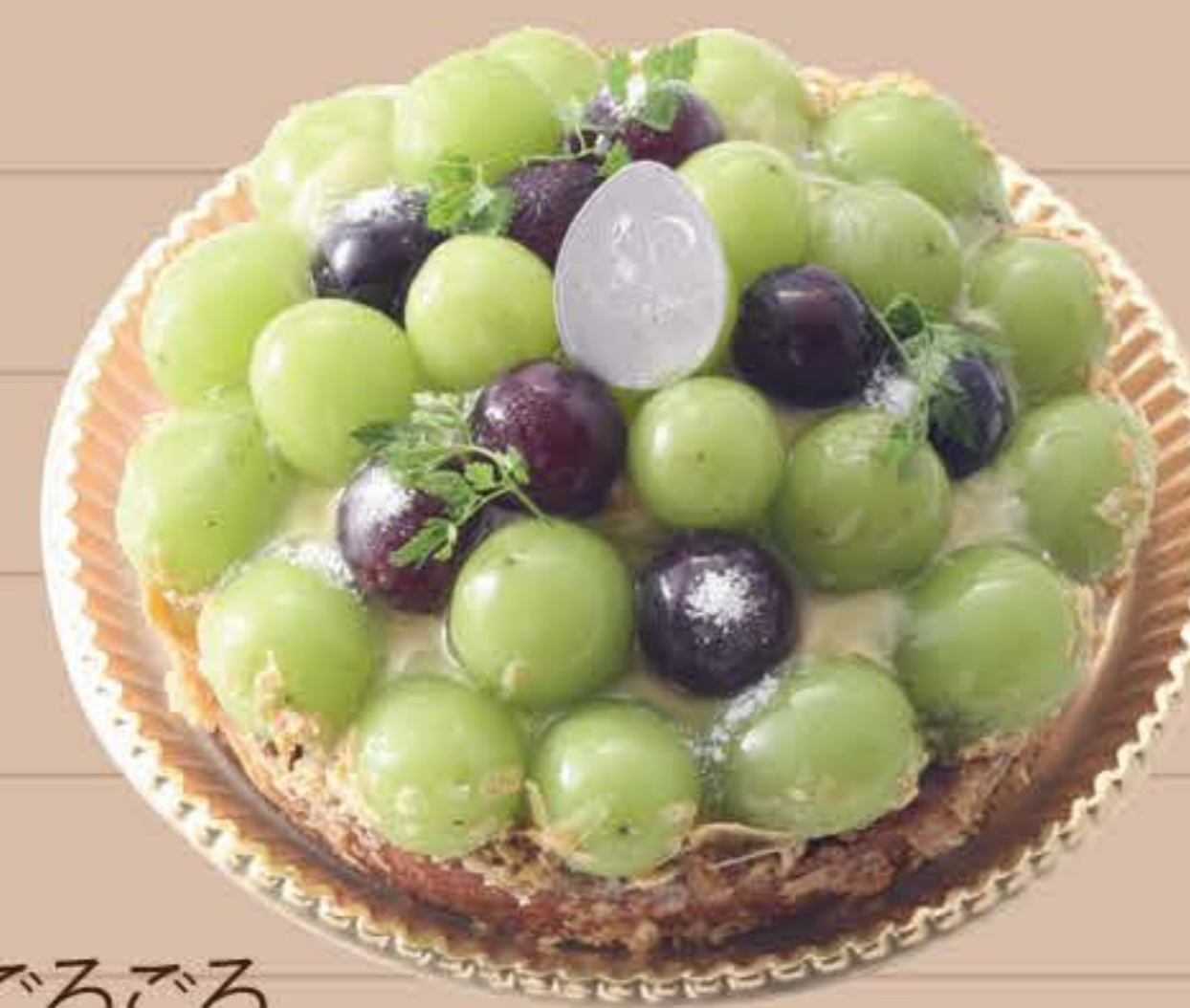
ごろごろ シャインマスカットタルト

4号 (12cm) … ¥3,600 (税込) 5号 (15cm) … ¥5,200 (税込) 6号 (18cm) … ¥6,700 (税込)