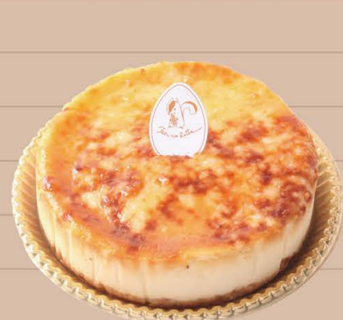
ベイウドカマンベール