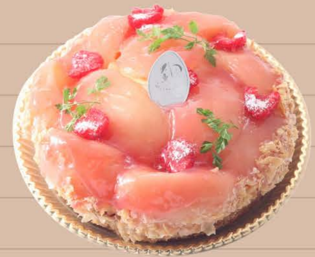
ごろごろ桃タルト

4号 (12cm) … ¥3,200 (税込) 5号 (15cm) … ¥4,800 (税込) 6号 (18cm) … ¥6,300 (税込)