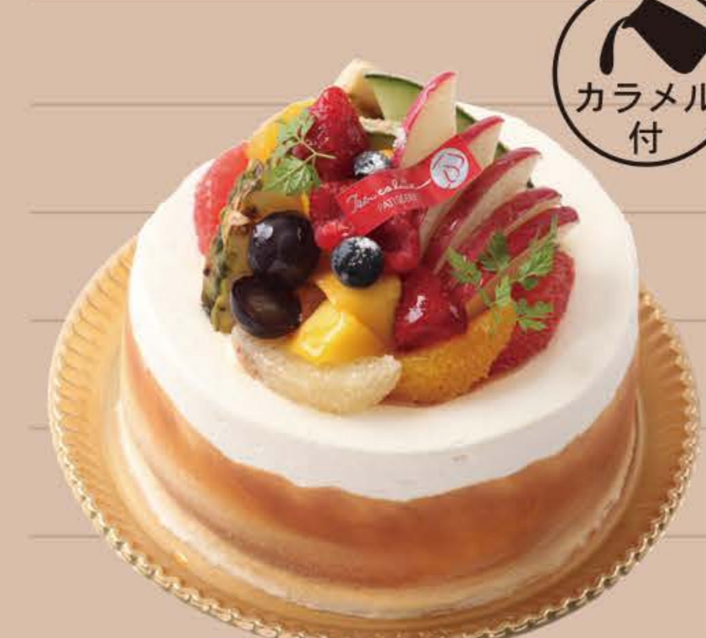
ティ・コ・ラッテ バニラキャラメル

5号… ¥3,000 (税込) 7号… ¥5,200 (税込) 6号… ¥4,200 (税込) 8号… ¥8,600 (税込)