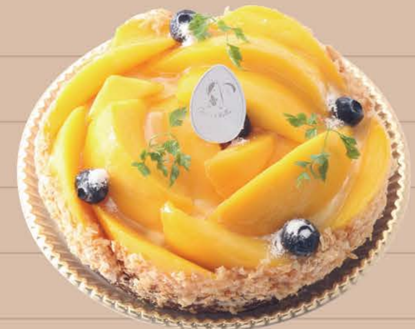
ごろごろマンゴータルト

4号 (12cm) … ¥2,900 (税込) 5号 (15cm) … ¥4,700 (税込) 6号 (18cm) … ¥5,800 (税込)